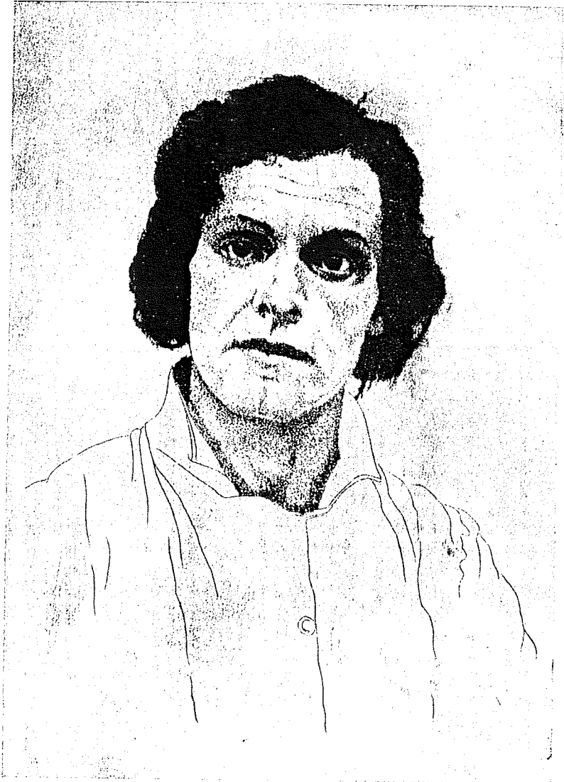
BILDNIS ALEXANDER MOISSI