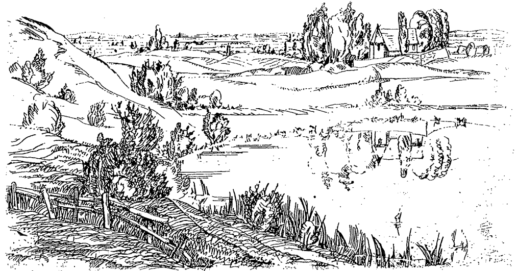
LANDSCHAFT MIT WEIHER

Nach einer schweren Kopfverletzung kurz vor Kriegsende an der italienischen Front trat eine große Lücke im künstlerischen Schaffen ein. Lederer wandte sich später wieder der Reproduktionsgraphik zu; als deren Ergebnis